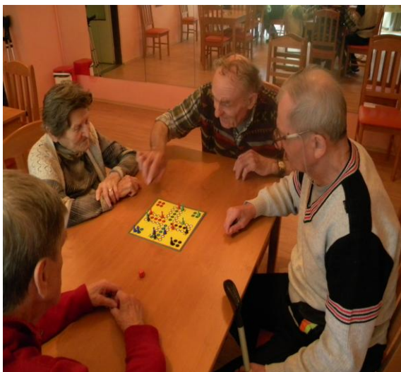
Hra „Člověče nezlob, se!“