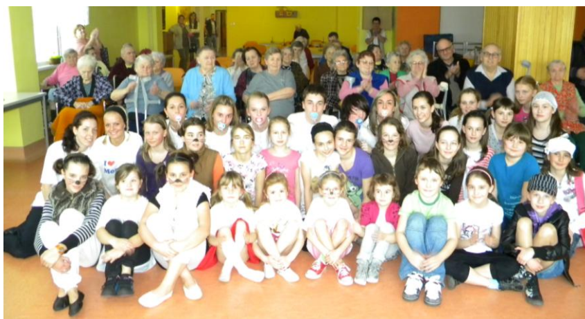
Taneční vystoupení Aktivity