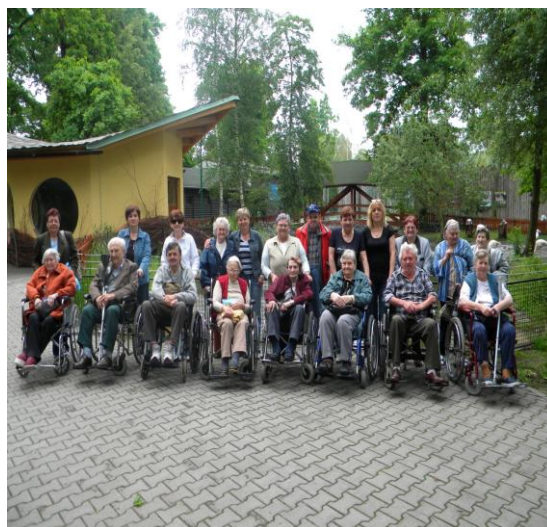
Výlet do ZOO Hodonín