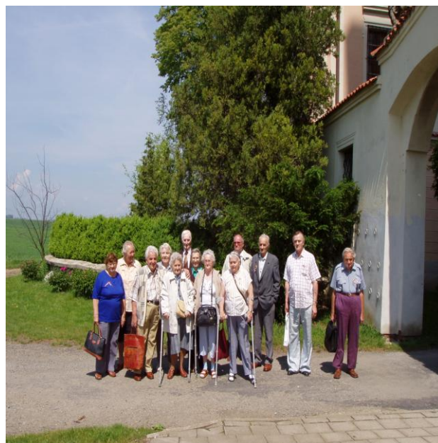
Výlet do Kroměříže (červen)