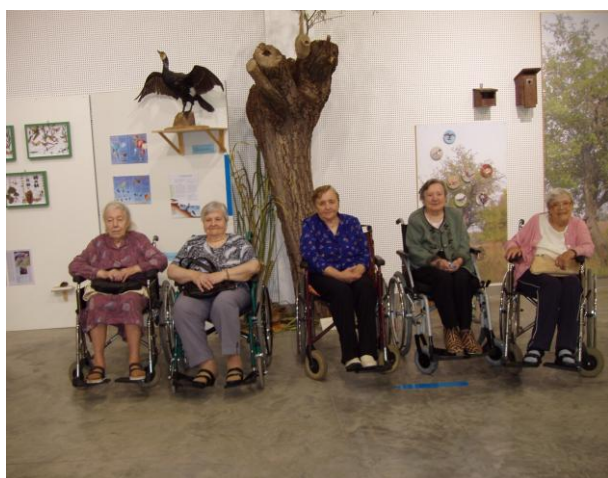
Výlet uživatelů upoutaných na invalidním vozíku (červen)