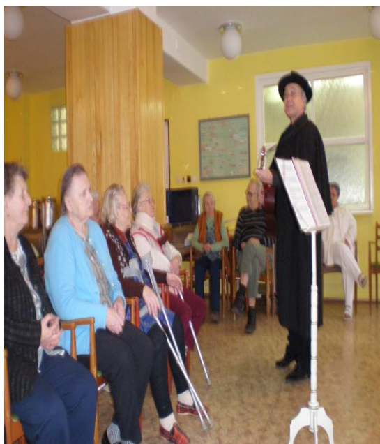
Vystoupení v DS Břeclav – Hašlerovy písničky (únor)